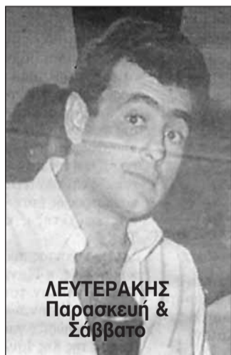
ΛΕΥΤΕΡΑΚΗΣ Παρασκευή & Σάββατο