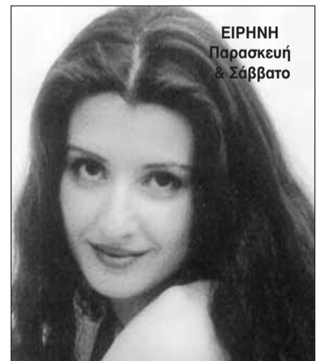
ΕΙΡΗΝΗ Παρασκευή & Σάββατο

Αυτή την Πέμπτη μεσημέρι το σπέσιαλ του Παντελή με μόνο $9 το άτομο. Τα παιδιά κάτω των 10 ετών ΔΩΡΕΑΝ.